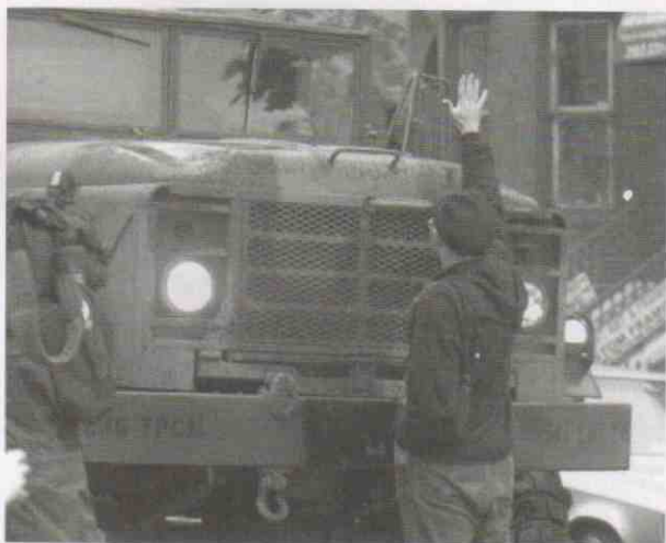
〔左圖〕在華盛頓的反世銀及國基會示威中，有示威者以身體阻止國民警衛隊的車輛前進

無論是作為受害者或幫兇，香港早已處於世銀／國基會所佈下的經濟格局之中，我們自然不能置於事外。