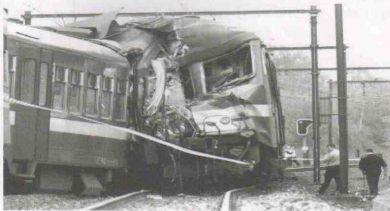
歐洲鐵路私營化以後，火車意外大增

硬要私企同公營相比，有時像是拿柚子同蘋果相比。私企唯利是圖，不僅可以不負任何社會責任，而且在許多情況下犧牲社會利益，例如工廠排出廢水廢氣、污染環境。現有的公營企業固然有許多缺點，但它往往要負起社會責任。房委會的私營化顧問報告指房署的管理成本比私營高出許多。他們忘記了，房署員工所身負的責任，是私營的所無的，例如處理調遷、調解住戶糾紛、轉介個案給社署、又或是執行房屋政策，包括處理雙倍租個案等等。水務署呢，它有責任向遍遠的地方供水，儘管為此每年支出千二萬，但是收到的水費不足二百萬元，是虧本生意。從資本家的錢眼看，虧本生意沒人做。然而，公營事業的宗旨恰恰不是唯利是圖，而是按需供應。這種虧本生意對維持整個社會的凝聚力、進步及和平是必不可少的。政府硬要公營事