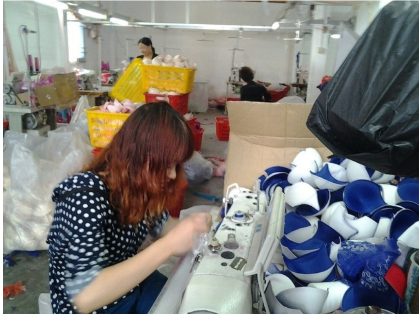
陈店某家工厂的内部情况 (生产材料胡乱放置，一旦发生火灾，工人逃生必然受阻)