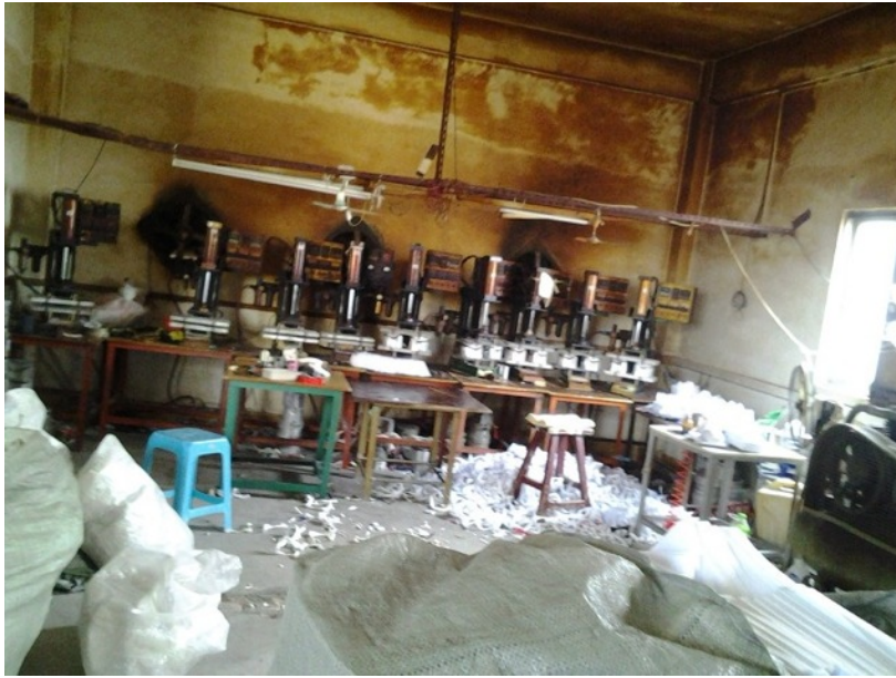
陈店某家工厂的内部情况(场身有烟熏过的颜色，反映机械的温度很高和有化学气体)