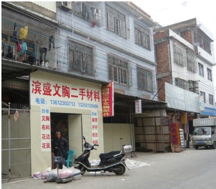
家庭小作坊的外部 (可见小作坊只有两至三层楼高，而且窗户都铁栏封死)